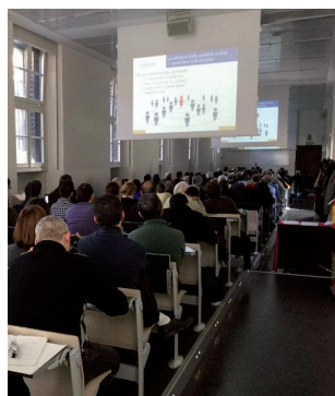
Milano, il corso per comunicatori dell'anno scorso