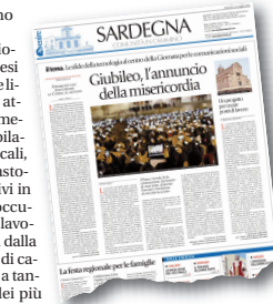
La copertina dell'inserto realizzato dalle diocesi della Sardegna pubblicato con Avvenire

All'interno della pubblicazione, ognuna delle dieci diocesi dell'isola ha approfondito le linee pastorali e descritto le attività realizzate negli ultimi mesi. Tra i numerosi segni giubilari promossi delle Chiese locali, spiccano gli incontri dei pastori con i carcerati, le iniziative in favore dei giovani, la preoccupazione e l'impegno per il lavoro, i nuovi servizi promossi dalla Caritas, gli intensi itinerari di catechesi e di preghiera uniti a tanti gesti solidali in favore dei più deboli; dodici pagine che mostrano il volto di un'intera isola impegnata a vivere con dedizione e impegno il Giubileo straordinario della misericordia.