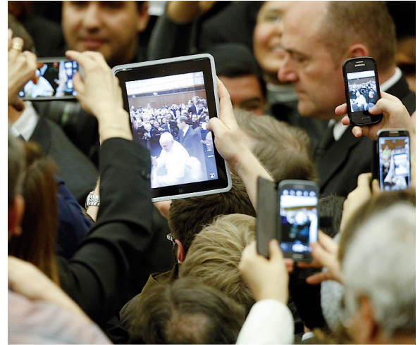
MEDIA. Cellulari e tablet durante un'udienza di papa Francesco nell'Aula Paolo VI

munica. Ebbene, si può scrivere o parlare in un modo o in un altro». Raspanti fa un esempio. «Nel nostro Paese ci sono argomenti che possono incendiare facilmente gli animi. Penso a quelli eticamente, politicamente o socialmente sensibili, in quest'ultimo caso il lavoro o l'immigrazione. Quando si interviene su questi temi, occorre evi-