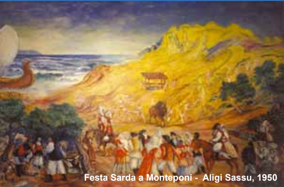
Festa Sarda a Monteponi - Aligi Sassu, 1950