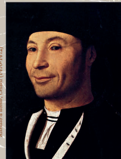
Ritratto d'uomo, Cefalù (1470-1472)

Prospettive filosofiche a confronto per un umanesimo decentrato