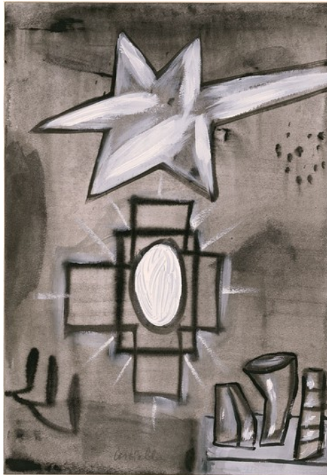
Mt 2,1-12 - Angelo Casciello Tecnica mista su carta Lezionario Domenicale e Festivo – Anno B Conferenza Episcopale Italiana

Le genti sono chiamate, in Cristo Gesù, a condividere la stessa eredità, a formare lo stesso corpo (Ef 3, 6)