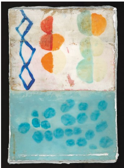
Is 63,16b-17.19b; 64,2-7 - Mirco Marchelli Cera, pigmenti, gesso su legno multistrato Lezionario Domenicale e Festivo – Anno B Conferenza Episcopale Italiana