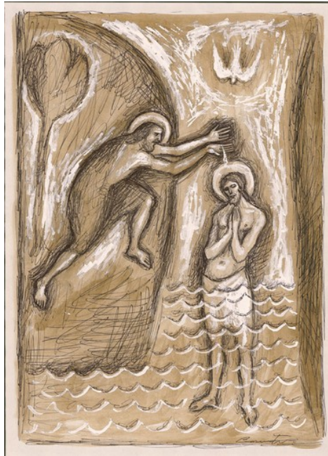
Mc 1,7-11 - Pietro Casentini Tecnica mista su carta Lezionario Domenicale e Festivo – Anno B Conferenza Episcopale Italiana

Tu sei il Figlio mio, l'amato: in te ho posto il mio compiacimento (Mc 1,11)