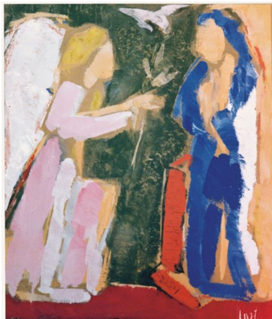
Lc 1,26-38 - Costantino Ruggeri Tempera su masonite Lezionario Domenicale e Festivo – Anno B Conferenza Episcopale Italiana

Sono stato con te dovunque sei andato, ho distrutto tutti i tuoi nemici davanti a te e renderò il tuo nome grande (2Sam 7,9)