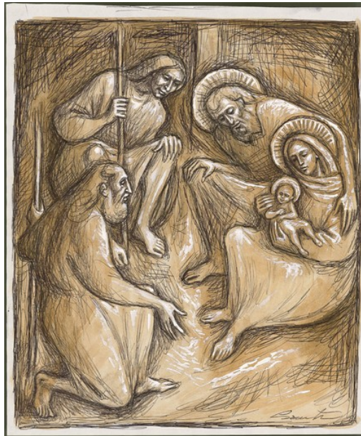
Lc 2,1-14 - Pietro Casentini Tecnica mista su carta Lezionario Domenicale e Festivo – Anno Conferenza Episcopale Italiana

Per fede Abramo, messo alla prova, offrì Isacco (Ebrei 11, 17a) (o è identico al Natale?)