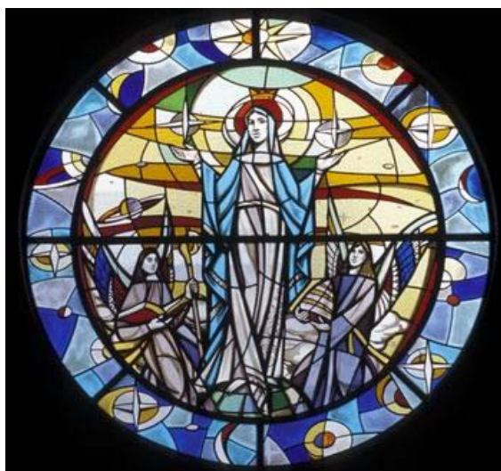
Madonna immacolata tra angeli Scuola d'Arte Camper sec. XX vetro in pasta colorato, cotto a fuoco, legato a piombo Diocesi di Pescara - Penne

Dove sei? Chi ti ha fatto sapere che sei nudo? Che hai fatto? (Gn 3,9.11.13)