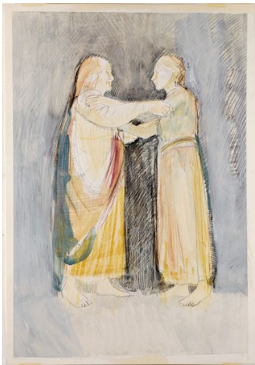
Lc 1,39-45 - Chiara Pasquetti Matita e tecnica mista su carta Lezionario Domenicale e Festivo – Anno B Conferenza Episcopale Italiana