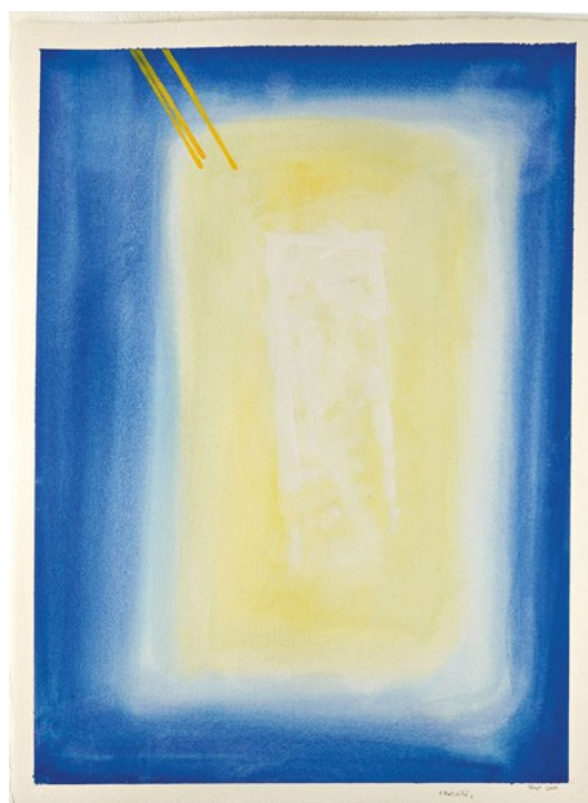
Gv 1,1-18 - Valentino Vago Tempera su cartoncino Lezionario Domenicale e Festivo – Anno B Conferenza Episcopale Italiana

Egli ha dato se stesso per noi, per formare per sé un popolo puro che gli appartenga (cf. Tt 2,14)