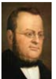
Camillo Benso conte di Cavour