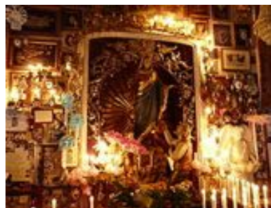
Statua della Madonna con gli ex voto

Nei pressi del Santuario, nello splendido contesto di Montallegro tra lecci centenari in posizione panoramica, ci sono due ristoranti, La Casa del Pellegrino e l'Hotel Ristorante Montallegro dove è possibile terminare piacevolmente la visita usufruendo di tariffe agevolate per gruppi.