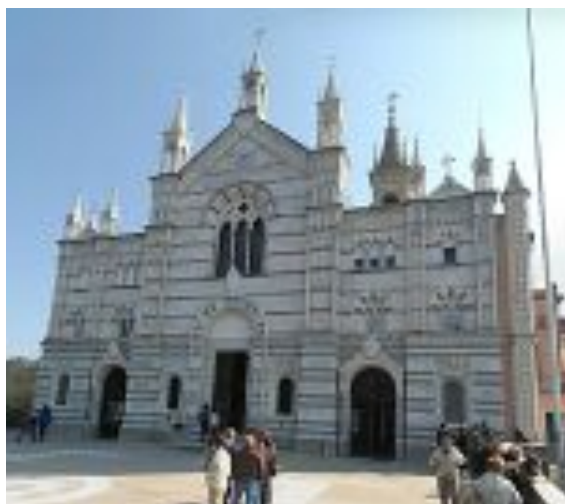
Santuario N.S. di Montallegro