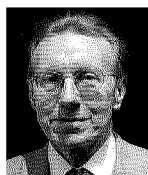
di Vittorio Possenti

L'avanzata di una nuova antropologia «laica»