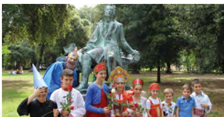
Bambini russo-italiani vicino al monumento di Aleksandr Pushkin a Villa Borghese a Roma.