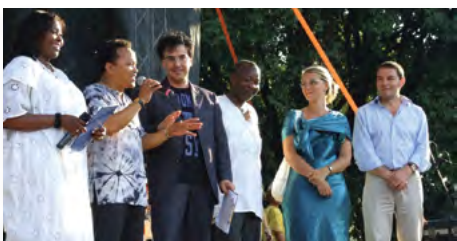
La Festa "Mondi a Roma" - 4 continenti si incontrano a piazza San Giovanni (Consiglieri Aggiunti con i presentatori del Concerto – luglio 2008)