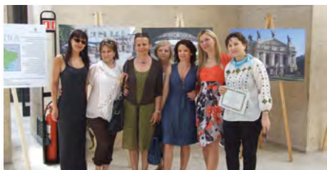
La chiusura del programma delle comunità dell'Europa dell'Est nell'ambito del progetto "I Futuri Cittadini di Roma Capitale" all'interno del Museo di Civiltà Romana (settembre 2011 – giugno 2012)