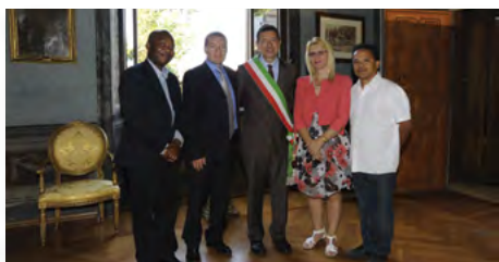
I gruppo di Consiglieri Aggiunti con il Sindaco Ignazio Marino.