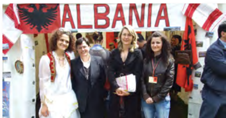
La Festa dei Popoli a piazza San Giovanni con la comunità albanese (maggio 2010)