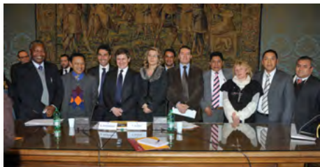
Consegna della Delega del Sindaco di Roma Gianni Alemanno per l'integrazione delle comunità straniere presenti a Roma (febbraio 2010) – Gruppo di Consiglieri Aggiunti e membri della Consulta Cittadina con il Sindaco