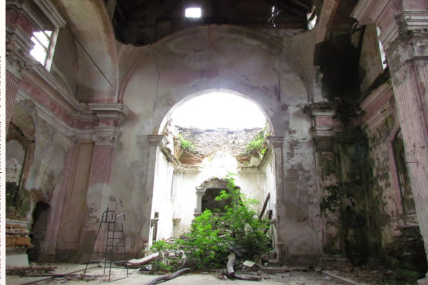
:: Chiesa di San Rocco ad Armeno (Novara, Italia) .

10:30 Turismo religioso: l'esperienza di "Catalonia Sacra" Religious tourism: the experience of "Catalonia Sacra"